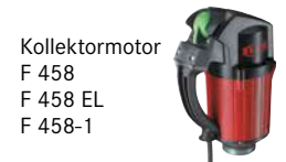
Kollektormotor F 458 F 458 EL F 458-1